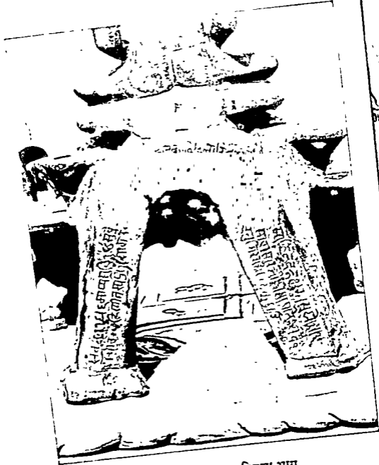
चतुर्विंशति पट्टक का विछला भाग